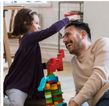
Photos prises avant les mesures de sécurité de distance physique COVID-19