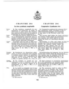
1906 – Adoption de la Loi sur les syndicats coopératifs par l'Assemblée nationale du Québec.