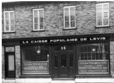
1900 – Fondation de la première coopérative d'épargne en Amérique, la Caisse populaire de Lévis par Alphonse et Dorimène Desjardins.