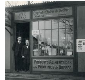
1922 – Naissance de la Coopérative fédérée de Québec , ancêtre de Sollio Groupe Coopératif, par la fusion de trois centrales coopératives : la Coopérative des fromagers de Québec, le Comptoir coopératif de Montréal et la Société des producteurs de semences de Sainte-Rosalie.