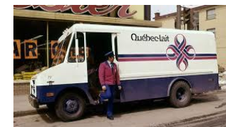
1938 – Fondation de la Société coopérative agricole de Granby , devenu Agropur.