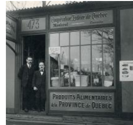
1922 – Naissance de la Coopérative fédérée de Québec , ancêtre de Sollio Groupe Coopératif, par la fusion de trois centrales coopératives : la Coopérative des fromagers de Québec, le Comptoir coopératif de Montréal et la Société des producteurs de semences de Sainte-Rosalie.

1940 – Création du Conseil de la coopération du Québec, devenu le Conseil québécois de la coopération et de la mutualité (CQCM).